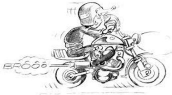
Association des Motards Chousséens